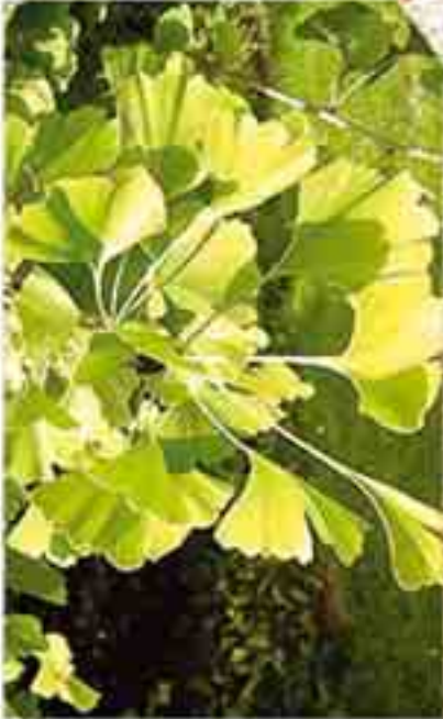
Günümüzdeki ginkgo yaprağı