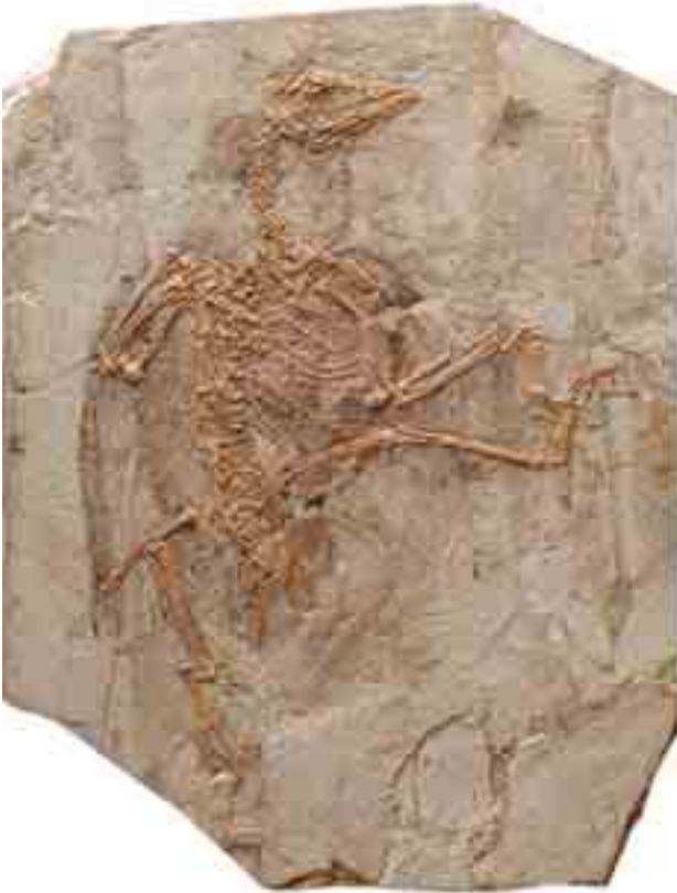
Confuciusornis 'in fosilinden detay (altta)